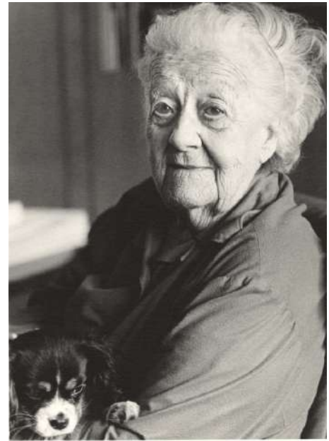
Germaine Tillion

Une opérette à Ravensbrück , préf. Tzvetan Todorov, Paris, Le Seuil, « Points », 2007.