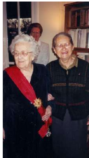
Geneviève de Gaulle et Germaine Tillion